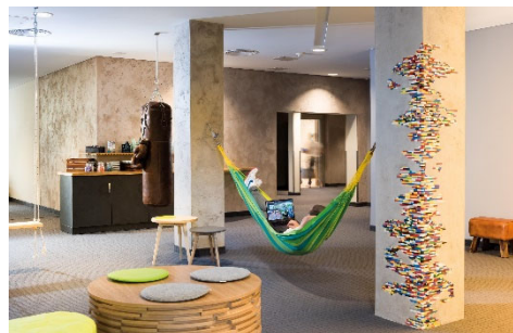
BU: Konferenz-Foyer Seminaris Hotel Bad Honnef