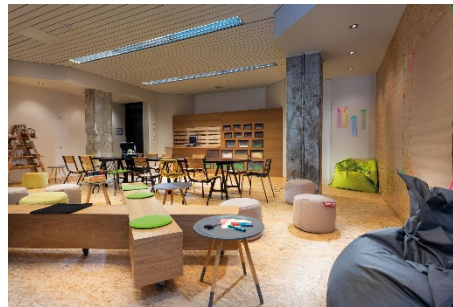
BU: Raum Think-Tank Seminaris Hotel Lüneburg