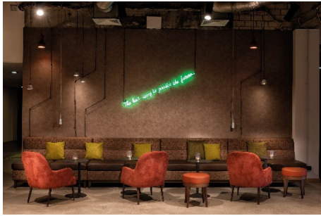
BU: Lobby Seminaris Hotel Lüneburg

Gastronomie-Konzept entwickelt, das die Gäste mit frischen, regionalen und saisonalen Gerichten überzeugt.