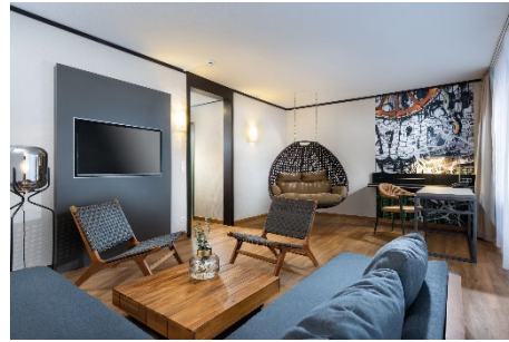
BU: Suite Seminaris Hotel Lüneburg