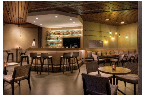
BU: Bar Seminaris Hotel Lüneburg